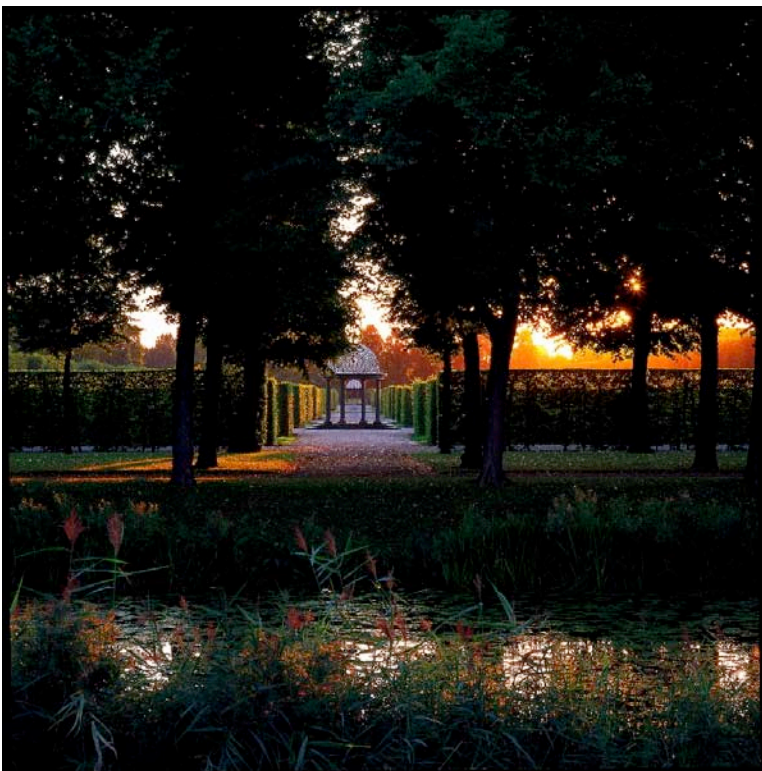
„Herrenhäuser Gärten“