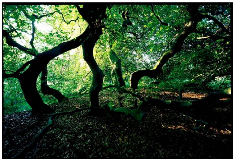
„Herrenhäuser Gärten“