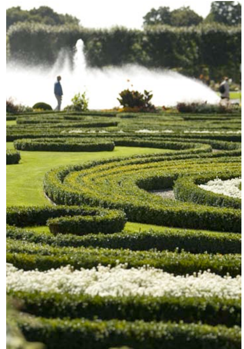
„Herrenhäuser Gärten“