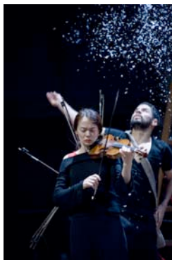
„4 Elemente—4 Jahreszeiten“