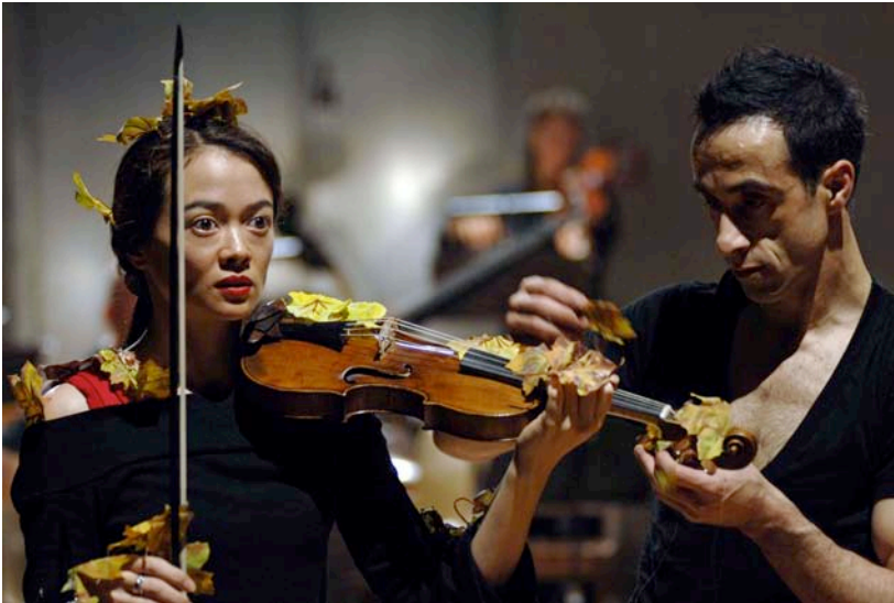
„4 Elemente – 4 Jahreszeiten“

Die Verwendung der Bilder ist nur im Kontext der Berichterstattung zu den ersten KunstFestSpielen Herrenhausen und unter Angabe der entsprechenden Bildcredits/Fotografen/Copyrights für die Presse frei. Gerne schicken wir Ihnen das Bildmaterial in höherer Auflösung zu. Weiteres Bildmaterial zu den einzelnen Produktionen erhalten Sie gerne auf individuelle Nachfrage. Belegexemplare erbeten (Goldmann PR, Zimmerstraße 11, 10969 Berlin). Pressekontakt: Goldmann PR, Tel.: +49 (0)30/259 357-10, E-Mail: isawilla@goldmannpr.de