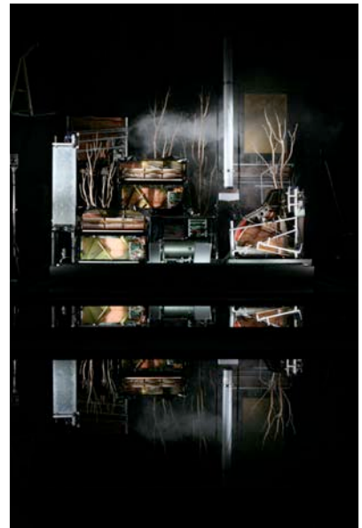
„Stifter Dinge“