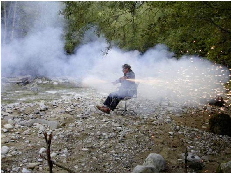
Roman Signer, Bürostuhl, 2006