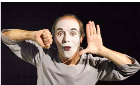
JOMI © Winfried Göttinger