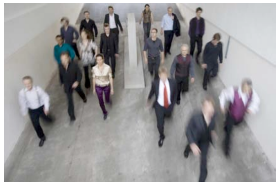
„Ensemble Modern“