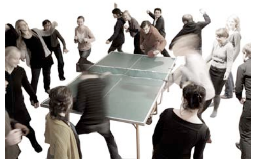
„Orfeo“, Ensemble Kaleidoskop © Aliénor Dauchez