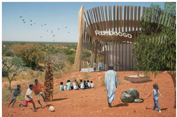
„Remdoogo - Das Operndorf“ (Collage) © Kéré-Architecture