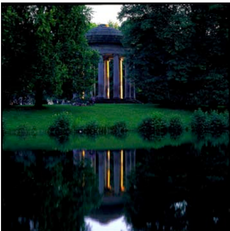
„Herrenhäuser Gärten“