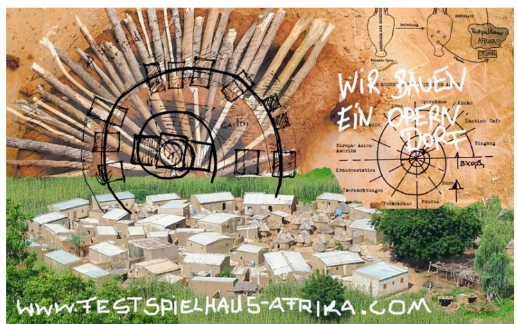
„Remdoogo – Das Operndorf“ (Collage) © Goerge/Schlingensiefel