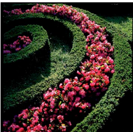
„Herrenhäuser Gärten“ © Nik Barlo jr.