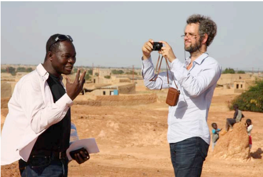
Francis Kéré und Christoph Schlingensiefel