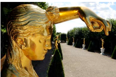
Herrenhäuser Gärten